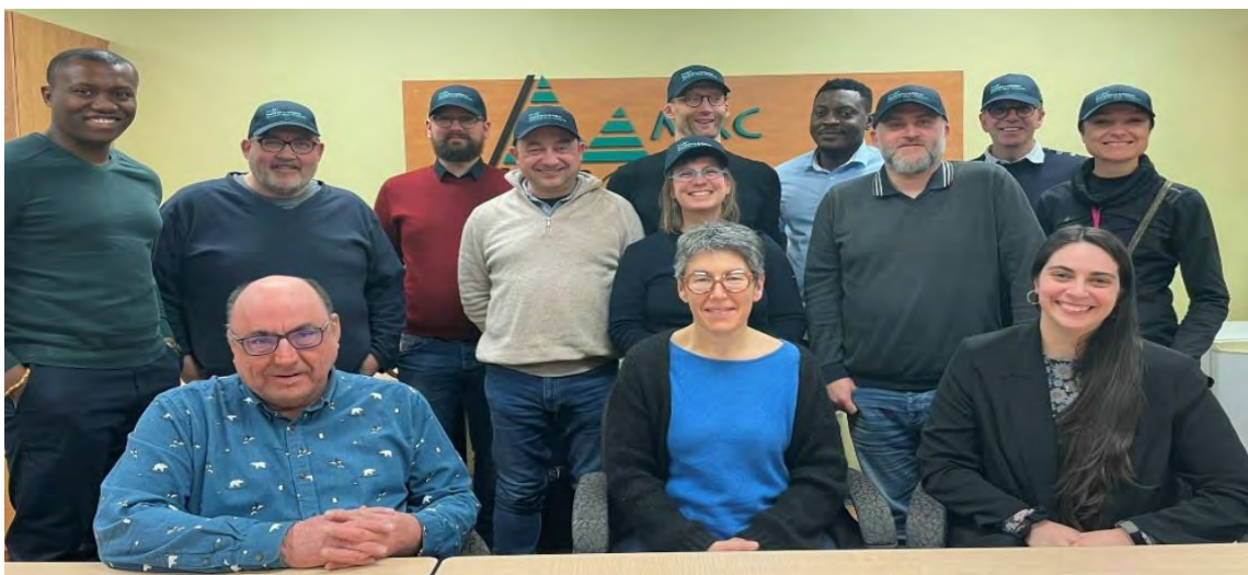
Rencontre entre l'équipe de la MRC, l'équipe de la CDROL et divers intervenants de développement économique provenant de la région de Bretagne, en France.

L'équipe a également accueilli une délégation de développeurs économiques de la région de Bretagne, en France , avec la collaboration avec la Coopérative de développement régional Outaouais-Laurentides . Ces précieux collaborateurs ont pu visiter 4 entreprises d'économie sociale sur le territoire.